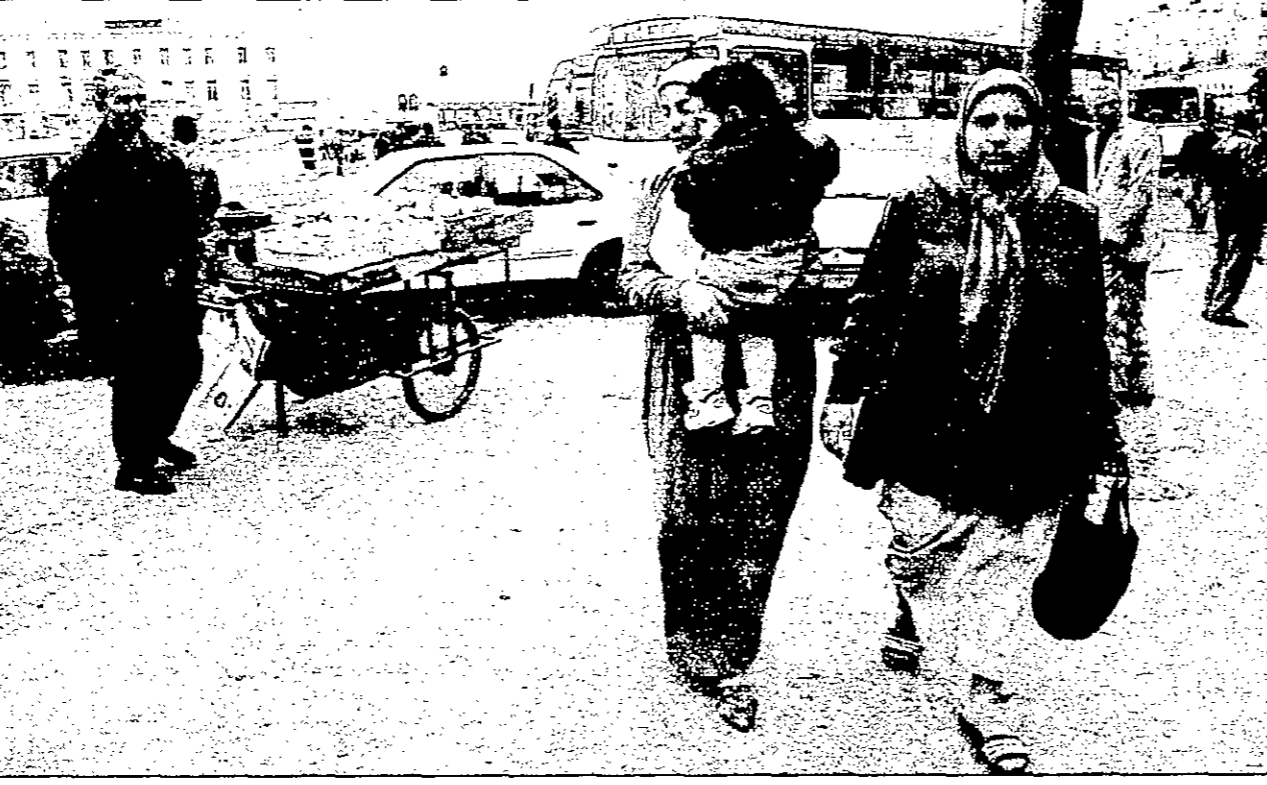
منظر لساكنة الشهداء بوسط الجزائر العاصمة والتي شهدت حركة مظاهرات في كل ايام رمضان

الجزائرية لاجراء تحقيق دولي بشأن المذبحة. ولم تحدد الجبهة ما اذا كانت تصر على اجراء تحقيق محلي ام دولي. وتزعم الجبهة ان عناصر من الجيش الامريكى قتلوا 11 مدنيا في مذبحة في البويرة. وقال مسؤولون ايطاليون انهم غير متأكد من هوية المهاجرين الذين تم ترحيلهم.